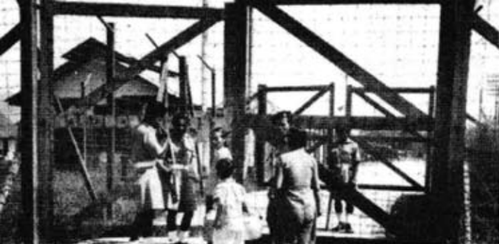
Kawasan penempatan Kampung Baru.