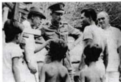
Templer melakukan lawatan untuk mendampingi rakyat.

Templer berusaha untuk memenangi kepercayaan Orang Asli supaya mereka menyokong kerajaan dalam usaha menghapuskan komunis. Beliau mendirikan 14 kubu untuk mendapatkan sokongan Orang Asli. Kubu ini menyediakan kemudahan barangan keperluan harian, perubatan, pendidikan dan perlindungan.