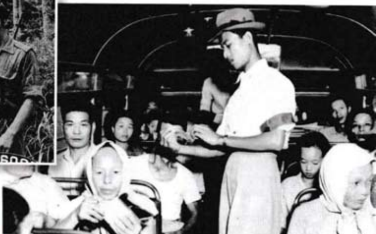
Anggota Special Constables sedang memeriksa kad pengenalan penumpang bas.

Apakah tujuan kad pengenalan diperkenalkan pada tahun 1948?