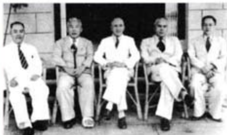
Sebahagian ahli jawatankuasa MCA.

Penubuhan Jawatankuasa Hubungan Antara Kaum (CLC) meningkatkan kesedaran politik dalam kalangan pemimpin kaum bahawa mereka boleh berkongsi kepentingan dan hala tuju yang sama melalui penubuhan Parti Perikatan (UMNO–MCA–MIC). Kemenangan Parti Perikatan dalam Pilihan Raya Umum 1955 memberikan keyakinan kepada British bahawa Persekutuan Tanah Melayu dapat menewaskan komunis melalui perpaduan penduduk yang berbilang kaum. Dalam suasana inilah, British memberikan kemerdekaan kepada Persekutuan Tanah Melayu. Dengan ini, PKM tidak mempunyai alasan untuk meneruskan perjuangannya.