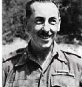
Sir Harold Rowdon Briggs