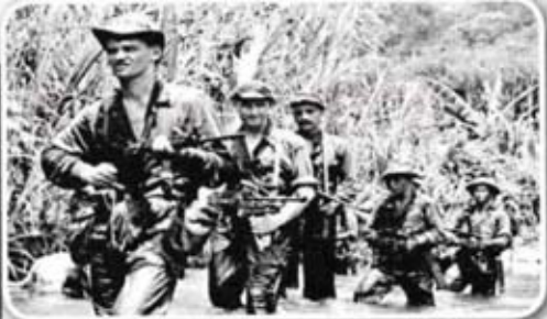
Pasukan Askar Komanwel.