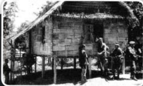
Pasukan Polis Senoi Praaq sedang melakukan pemeriksaan di perkampungan Orang Asli.