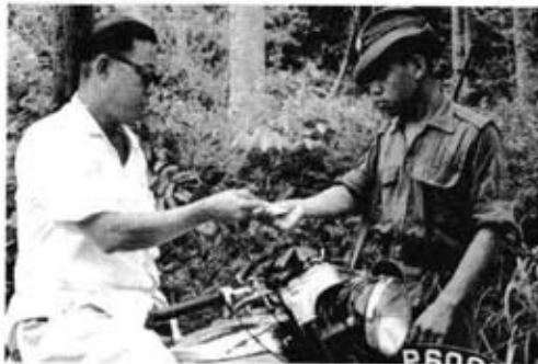
Pemeriksaan kad pengenalan oleh anggota keselamatan.