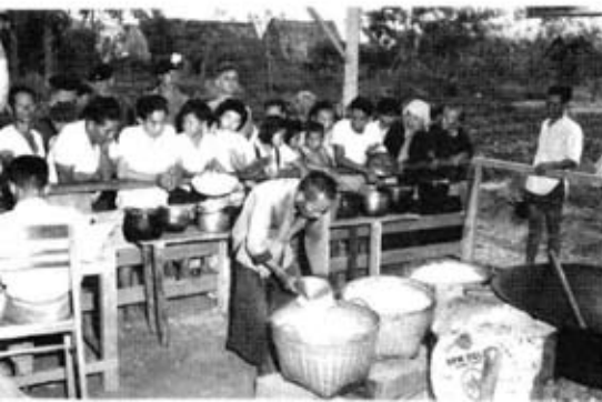
Pengagihan makanan di Kampung Baru.

Penduduk setingan di pinggir hutan dipaksa berpindah dari kampung halaman ke sebuah petempatan baharu yang agak asing. Kawasan penempatan semula ini digelar sebagai "Kampung Baru". Kampung Baru dilengkapi dengan kemudahan tempat tinggal, bekalan elektrik, air paip, sekolah dan kemudahan kesihatan. Selain itu, petempatan ini juga mempunyai kemudahan pusat komuniti dan rumah ibadat. Jawatankuasa kampung ditubuhkan untuk memelihara dan memperbaiki kemudahan di Kampung Baru itu. Kampung Baru juga dipagari dengan kawat berduri dan dikawal oleh Special Constables. Sehingga bulan Mac 1952, lebih daripada 423 ribu orang penduduk di pinggir hutan dipindahkan ke 410 buah Kampung Baru.