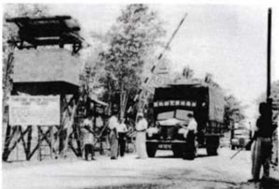
Pemeriksaan sedang dijalankan oleh Home Guard untuk membanteras komunis.

Sumber: Mohd Azzam Mohd Hanif Ghows, 2007. The Malayan Emergency Revisited 1948-1960 . Edisi kedua. Kuala Lumpur: AMR Holding Sdn. Bhd.