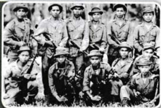
Pasukan Askar Melayu.

Sumber: Mohd Azzam Mohd Hanif Ghows, 2007. The Malaysian Emergency Revisited 1948-1960 . Edisi kedua. Kuala Lumpur: AMR Holding Sdn. Bhd.