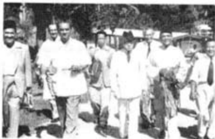
Kedatangan wakil kerajaan. Dua dari kiri David Marshall, Tan Cheng Lock dan Tunku Abdul Rahman.

Tunku Abdul Rahman meminta Chin Peng membubarkan PKM, meletakkan senjata dan menyerah diri. Chin Peng pula menetapkan syarat, iaitu peletakan senjata dan penyerahan diri akan dibuat seandainya kerajaan bersetuju mengakui PKM sebagai sebuah parti politik yang sah. Tunku Abdul Rahman enggan menerima syarat tersebut. Oleh hal yang demikian, rundingan tersebut telah menemui kegagalan.