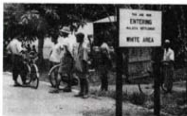
Kawasan putih yang diisytiharkan di Melaka.

Sehingga tahun 1954, kerajaan mengisytiharkan Melaka, Terengganu, Kedah, Perlis dan Negeri Sembilan sebagai kawasan putih.