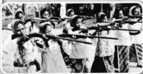
Anggota pasukan Home Guard wanita.