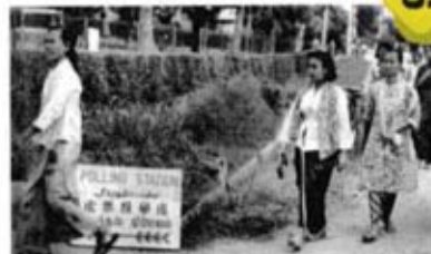
Penduduk keluar mengundi.

Sumber: Mohd Azzam Mohd Hanif Ghows, 2007. The Malaysian Emergency Revisited 1948-1960 . Edisi kedua. Kuala Lumpur: AMR Holding Sdn. Bhd.