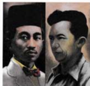
Ilustrasi Alimin dan Tan Malaka

Bincangkan kemasukan pengaruh komunis di negara kita.