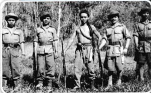
Anggota Sarawak Rangers (Iban Tracker).

Sumber: Mohd Azzam Mohd Hanif Ghows, 2007. The Malayan Emergency Revisited 1948-1960 . Edisi kedua. Kuala Lumpur: AMR Holding Sdn. Bhd.