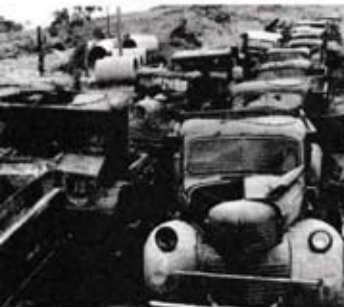
Lori yang dibakar oleh komunis.