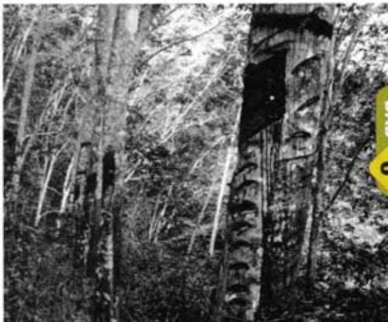
Pokok getah yang dirosakkan oleh komunis untuk melumpuhkan ekonomi.