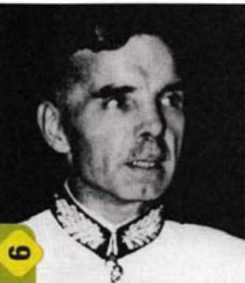
Sir Edward Gent, Pesuruhjaya Tinggi British di Tanah Melayu.

Seterusnya, pada 18 Jun 1948, undang-undang ini dikuatkuasakan ke seluruh Tanah Melayu. Dengan itu, usaha membanteras ancaman komunis di Persekutuan Tanah Melayu bermula dengan rasminya.