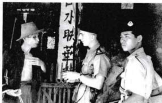
Kad pengenalan Persekutuan Tanah Melayu.