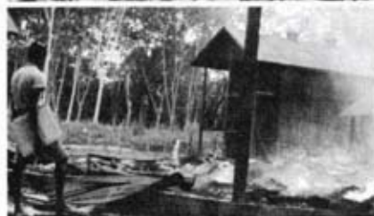
Ladang getah dan rumah kediaman yang telah dibakar oleh komunis.